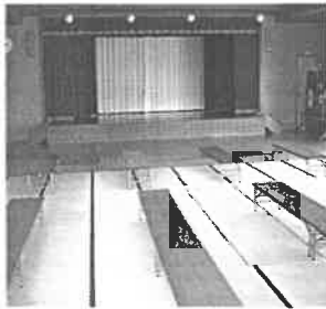
大広間 (カラオケ、舞台催し物等)