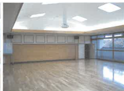
2階 ふれあいミニホール